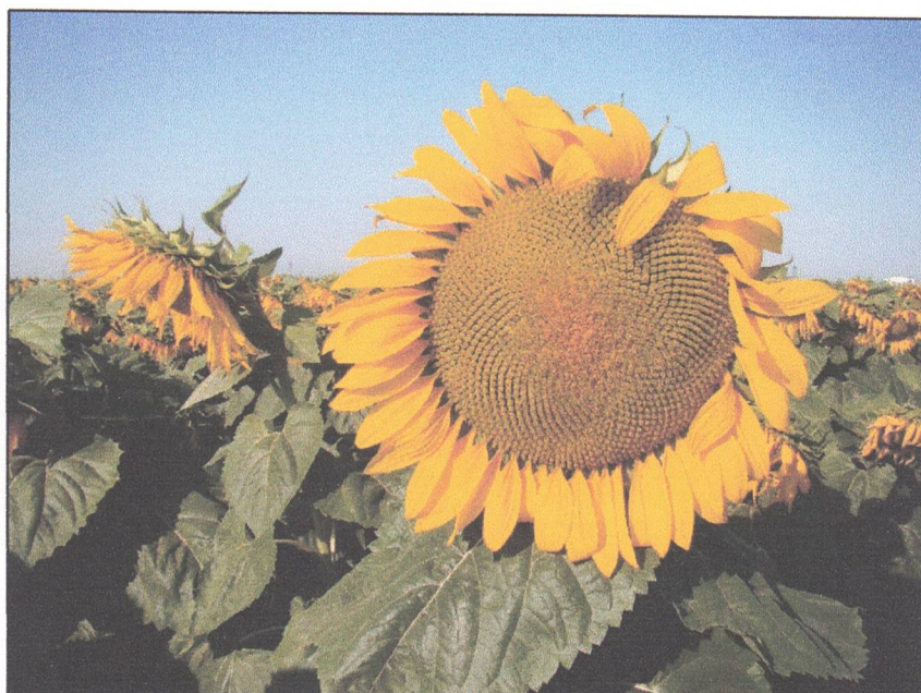
Linie nouă de floarea-soarelui obținută la INCDA Fundulea