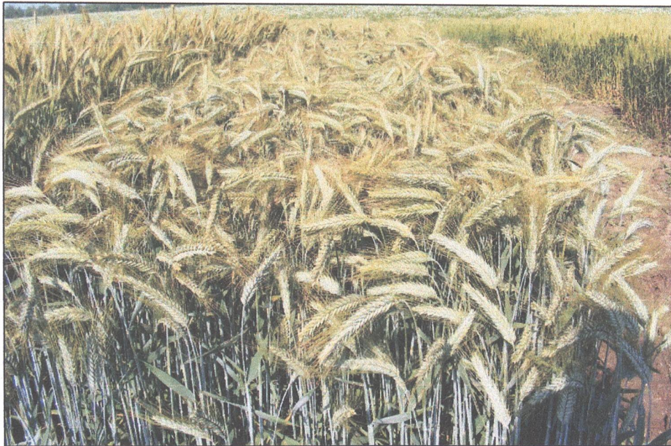
Soiul de triticale Haiduc