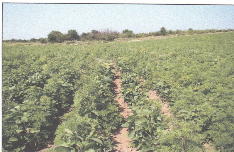
Fig 2. Cultură de soia acoperită aproape total de Ambrosia artemisiifolia