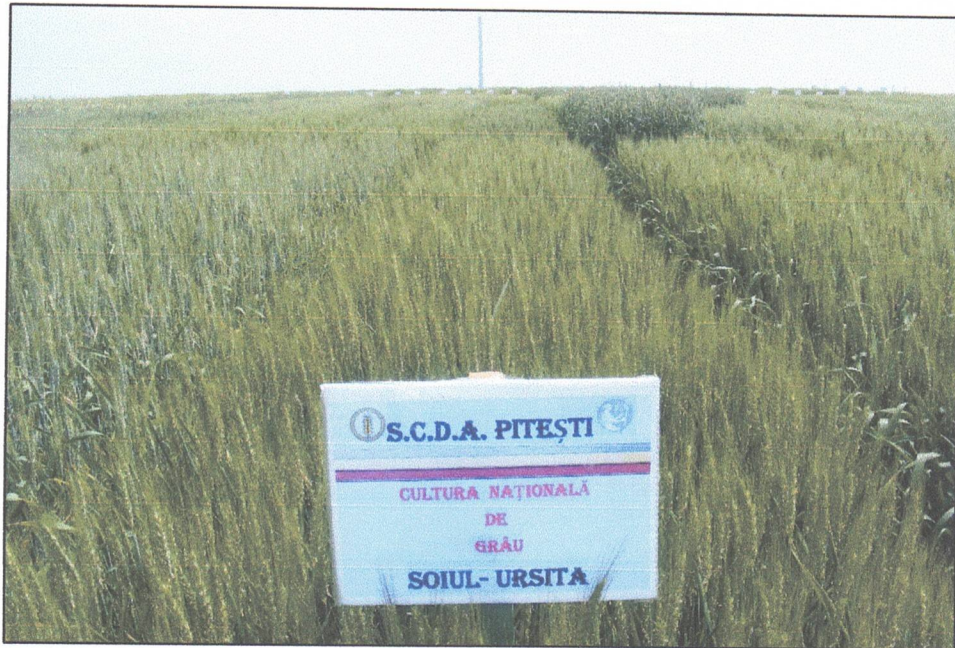
Soiul de grâu Ursita