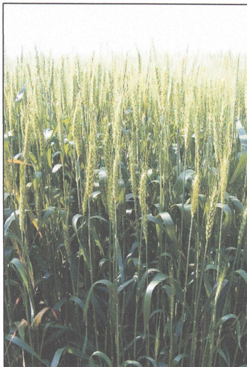
Grâul din rotația de 6 ani