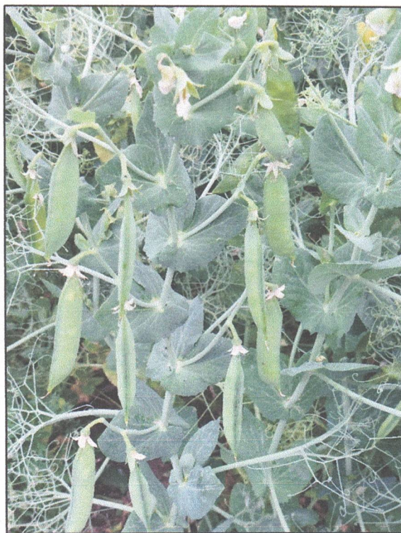
Soiul Avatar din varianta scarificată