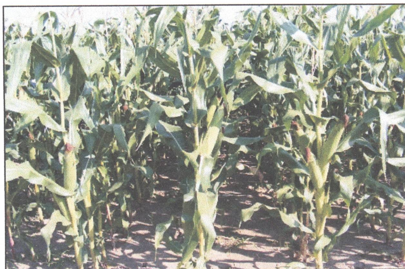
Fig. 1. Linie nouă de porumb, cu capacitate de producție ridicată