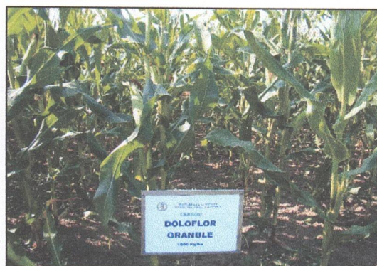
Fig. 3 și 4. Aspecte ale grâului și porumbului tratate cu \text{CaCO}_3 : Agrocalcium și Doloflor