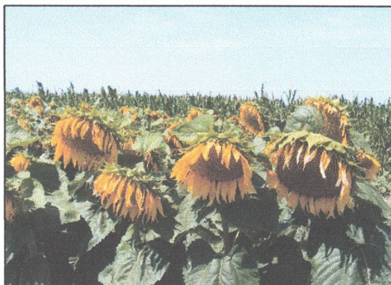
Porumb și floarea-soarelui fertilizate cu Fertisfera