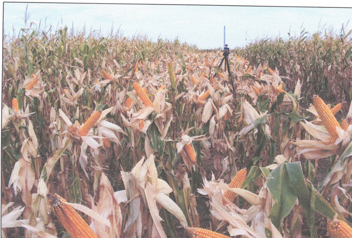
Porumbul din rotația de 6 ani

1.10. Rezultate noi privind promovarea unor insecticide biologice noi în combaterea principalilor dăunători la porumb. S-a avut în vedere că pe fondul schimbărilor climatice pe de o parte când unii dăunători de tipul insectelor, dar și al necesității protejării mediului agricol de cultură, cer aceste schimbări necesare, s-au efectuat o serie de teste. Director de proiect..