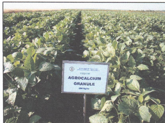
Fig. 5 și 6. Aspecte ale fl. soarelui și soiei tratate cu CaCO 3 : agrocalcium granule